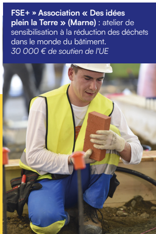
FSE+ » Association « Des idées plein la Terre » (Marne) : atelier de sensibilisation à la réduction des déchets dans le monde du bâtiment. 30 000 € de soutien de l'UE