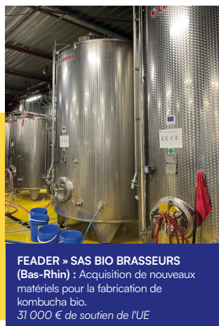
FEADER » SAS BIO BRASSEURS (Bas-Rhin) : Acquisition de nouveaux matériels pour la fabrication de kombucha bio. 31 000 € de soutien de l'UE