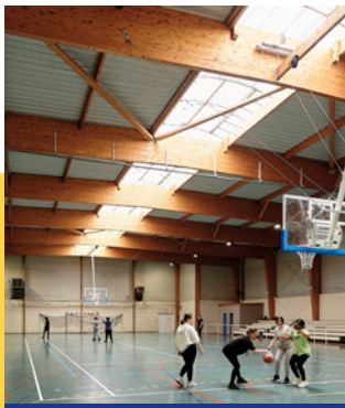
FEDER » Commune de Fameck (Moselle) : Rénovation thermique et fonctionnelle de la cité des sports. 250 000 € de soutien de l'UE

Le Fonds pour une transition juste atténue les effets de la transition vers la neutralité climatique et investit dans la diversification économique, l'innovation et les énergies totalement renouvelables.